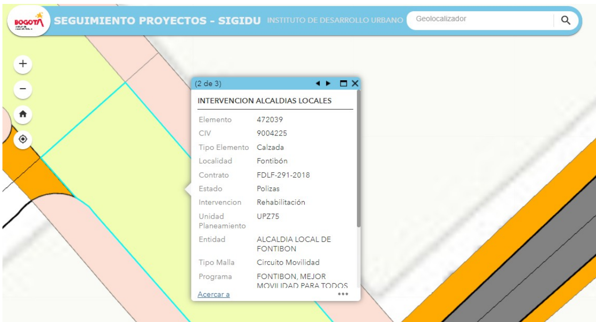
FIGURA 2. Fuente: SIGIDU (1-octubre-2021)

Con base en la verificación efectuada y los datos registrados en el SIGIDU y el SIGMA, el tramo correspondiente a la Calle 18 entre Carrera 113 y Avenida Carrera 116 cuenta con Póliza de Estabilidad vigente ( hasta 22-diciembre-2024 ) del contrato FDLF – 291 – 2018 por parte de la Alcaldía Local de Fontibón (Figura 2).