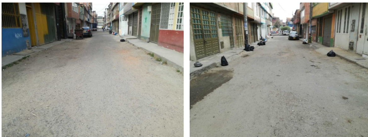
Figura 2 – Carrera 89F entre la Calle 41 Sur y la Calle 42 Sur

Con base en la visita técnica de inspección visual realizada, fue posible establecer que el tramo de la Carrera 89F entre la Calle 41 Sur y la Calle 42 Sur cuenta con Fresado Estabilizado, es de uso vehicular y requiere ser intervenido mediante actividades de Rehabilitación (Figura 2).