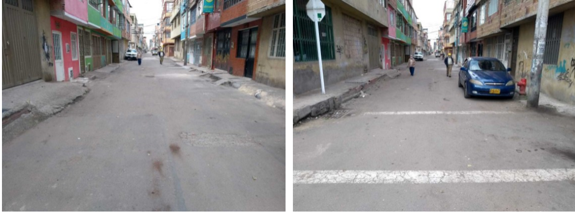
Figura 3 – Carrera 93C entre la Calle 41 Sur y la Calle 42 Sur

tramo de la Carrera 93C entre la Calle 41 Sur y la Calle 42 Sur cuenta con pavimento Flexible, es de uso vehicular y requiere ser intervenido mediante actividades de Mantenimiento Periódico (Figura 3).