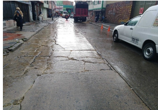
Calle 163 entre carrera 8D y carrera 8G