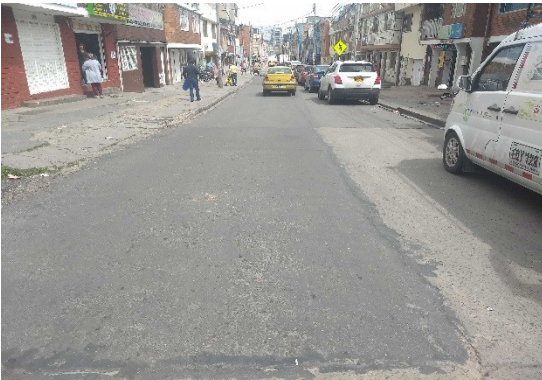
Calle 163 entre carrera 8 y carrera 8B