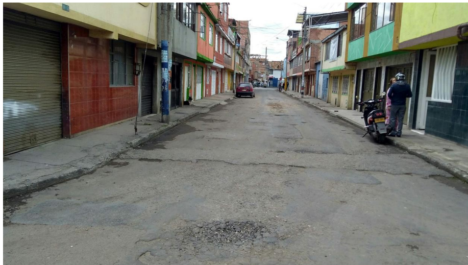
Figura 1- Calle 38 F Sur entre carrera 68C y carrera 68D

Una vez realizada la verificación pertinente y de acuerdo con el procedimiento de evaluación de vías, el tramo correspondiente a la vía de su solicitud no se encuentra incluido dentro de la programación de actividades vigente y teniendo en cuenta que los programas que lleva a cabo la Entidad son ejecutados con recursos a monto agotable, no es posible para la UAERMV intervenir dicho tramo.