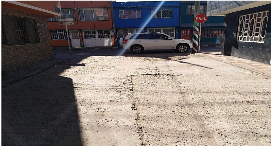
Carrera 79A diagonal 73D Bis Sur

con superficie en pavimento rígido, es de uso vehicular y requiere ser intervenida mediante actividades de mantenimiento y/o rehabilitación (Figura 2).