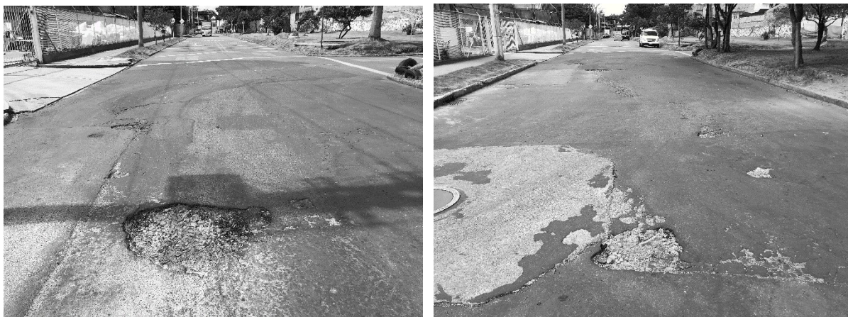
Figura 1 – Carrera 65B con Calle 10

Una vez realizada la verificación pertinente y de acuerdo con el procedimiento de evaluación de vías, los tramos correspondientes a las vías de su solicitud no se encuentran incluidos dentro de la programación de actividades vigente y teniendo en cuenta que los programas que lleva a cabo la Entidad son ejecutados con recursos a monto agotable, no es posible para la UAERMV intervenir dichos tramos.