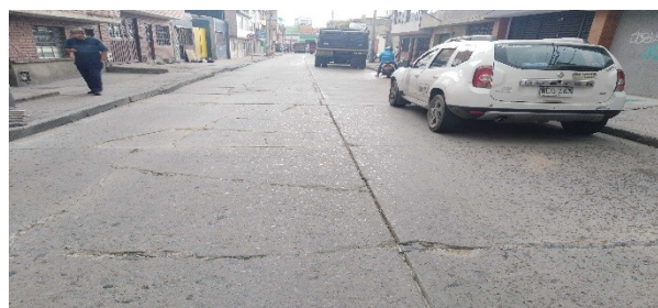
Calle 163 entre carrera 8D y carrera 8G