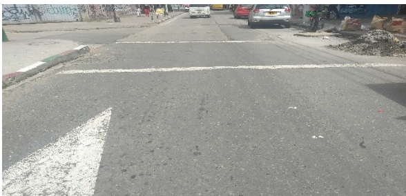
Calle 163 entre carrera 8 y carrera 8B