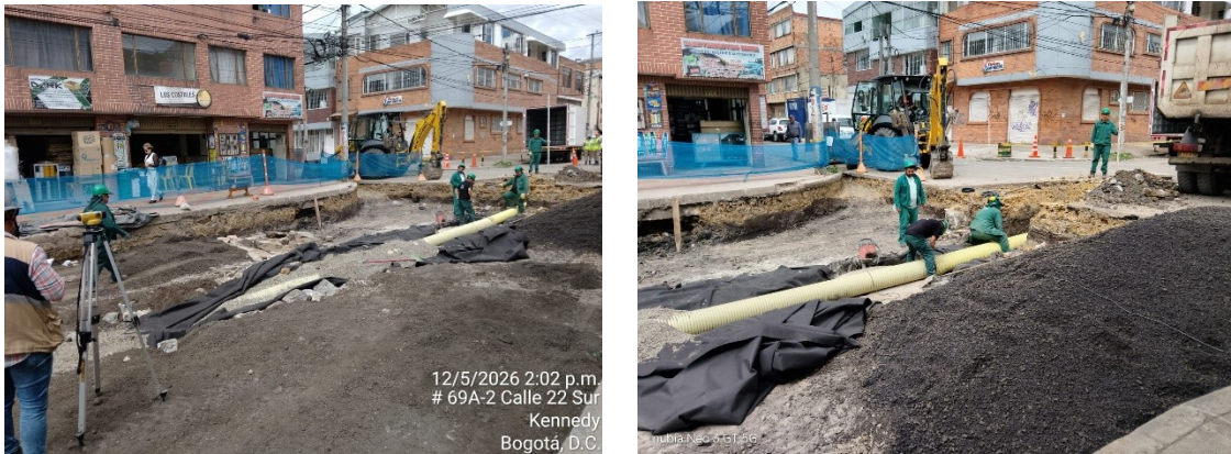
Imagen No. 02. Intervención del segmento vial.

El segmento vial se encuentra en ejecución a la fecha, las actividades de instalación de tubería de aguas lluvias y construcción de pozos, se realiza en coordinación con la Empresa de Acueducto y Alcantarillado de Bogotá EAAB, y se pretende terminar la intervención para el mes de junio de 2026.