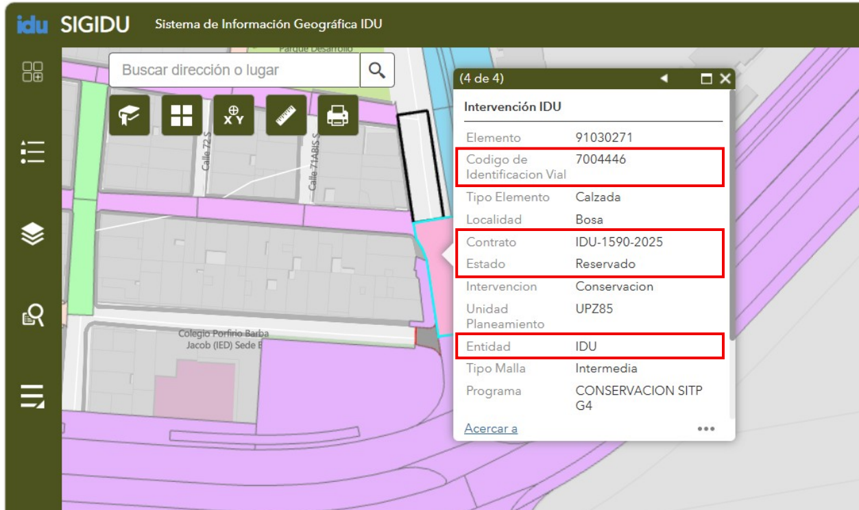
Imagen 1. Fuente: SIGIDU (1-junio-2026)

Desde el alcance de las funciones asignadas a la entidad y de acuerdo con el procedimiento de evaluación de vías, los tramos viales correspondientes a las direcciones de su requerimiento, actualmente no se encuentran incluidos dentro de la programación de actividades vigente y adicionalmente, los PK 91.030.271 y 91.028.806 se encuentra reservado a la fecha ante el Instituto de Desarrollo Urbano - IDU, por parte del Instituto de Desarrollo Urbano - IDU, tal como se muestra en la imagen 1, por lo tanto, no es posible para la UAERMV intervenir dichos tramos.