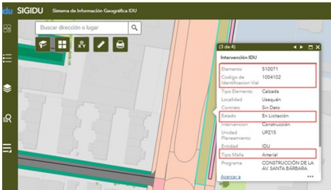
Imagen 1 Fuente: SIGIDU (14-mayo-2026)

La Unidad Administrativa Especial de Rehabilitación y Mantenimiento Vial (UAERMV) de acuerdo con la información referida, revisó dichos tramos en el Sistema de Información Geográfico del Instituto de Desarrollo Urbano (SIGIDU) y en el Sistema de Información Geográfica Misional y de Apoyo (SIGMA) e identificó que la dirección de su comunicación corresponde a la Avenida carrera 19, que hace parte de la malla vial arterial de la ciudad.