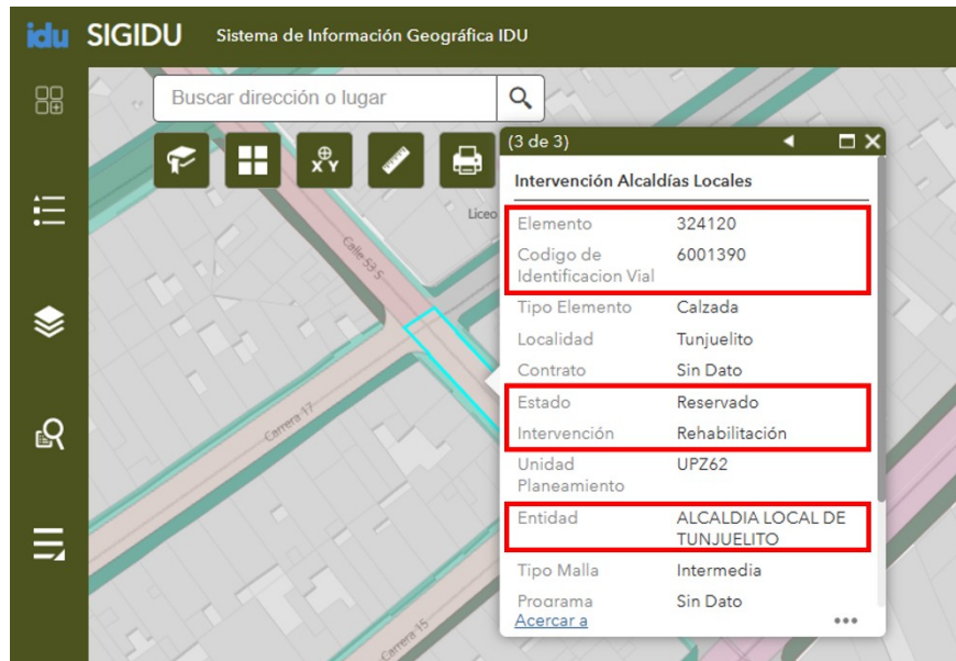
Imagen 1. Fuente: SIGIDU (24-abril-2026)

PK_ID: Llave de Identificación / CIV: Código de Identificación Vial / LO: Local / IN: Intermedia / AR: Arterial