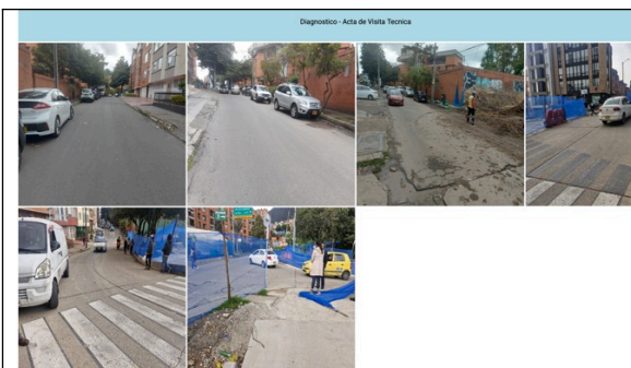
Ilustración 3, Registro fotográfico de Diagnostico