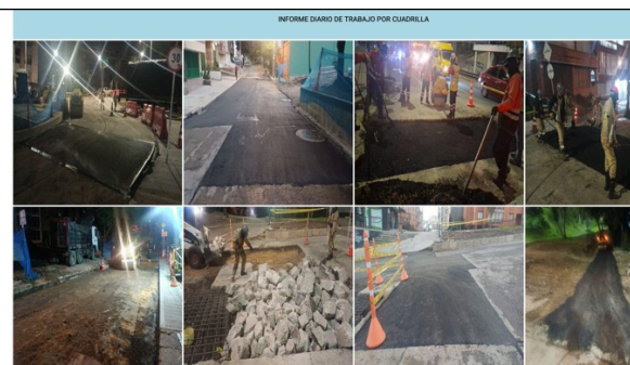
Ilustración 4, Registro fotográfico ejecución

Ahora, habiéndose ya culminado nuestras labores, es posible que distintas entidades se encuentren aún en intervención, por lo que se enviará copia de este comunicado a la Empresa de Acueducto y Alcantarillado de Bogotá – ESP y el Instituto de desarrollo Urbano