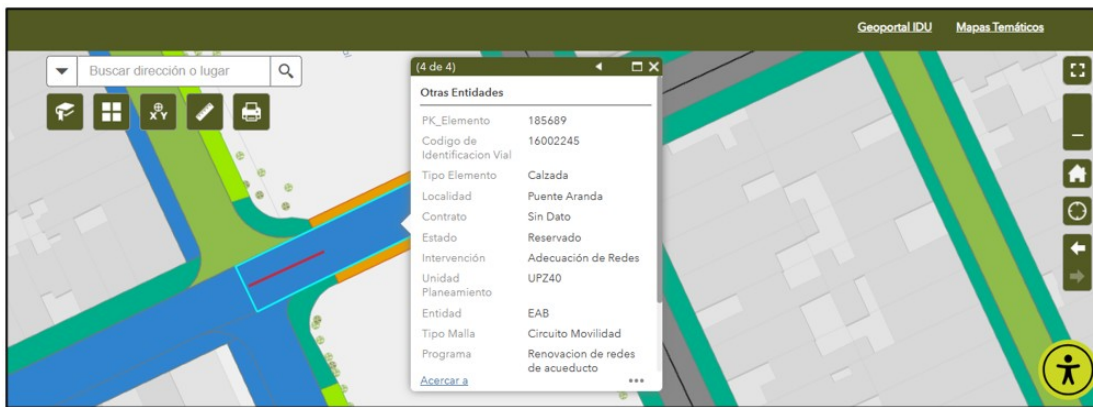
FIGURA 1. Fuente: SIGIDU (10-abril-2024)

Adicionalmente, de acuerdo con la verificación efectuada y los datos registrados en el SIGIDU y el SIGMA, el tramo correspondiente a la dirección de su solicitud se encuentra reservado a la fecha, por parte de la Empresa de Acueducto, Alcantarillado y Aseo de Bogotá - EAB-ESP. (Figura 1).