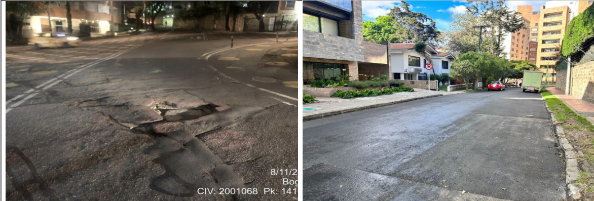
KR 4 ENTRE CL 75 Y DG 76 PK 141683- CIV 2001068

La Entidad se permite señalar que, las actividades de mantenimiento realizadas correspondieron a parcheos que son actividades superficiales en las que se reemplazó exclusivamente la carpeta asfáltica de pavimento en zonas puntuales identificadas, teniendo en cuenta las fallas encontradas en el pavimento sin afectación alguna a las capas granulares existentes y con el único fin de solucionar y garantizar las condiciones de movilidad vial del sector.