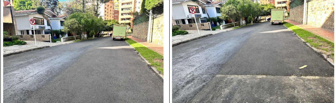
KR 4 ENTRE CL 75 Y DG 76 PK 141683- CIV 2001068

Finalmente le manifestamos nuestra voluntad de servicio en pro de mejorar la calidad de vida de todos los bogotanos y expresamos nuestra disposición para continuar trabajando por Bogotá.