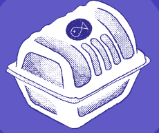
productos de poliestireno y envases (ICOPOR)

envases hechos de materiales biodegradables o compostables, como platos y cubiertos de almidón de maíz,