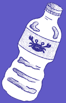
botellas y tapas plásticas

bolsas de tela, bolsas de yute, o bolsas de malla reutilizables para llevar tus compras