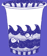
Vasos y platos plásticos desechables

botellas de agua reutilizables de acero inoxidable, vidrio o plástico duradero