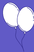
globos y palitos para globos

Elige negocios con empaques responsables