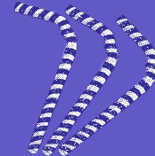
mezcladores y pitillos plásticos

Compra alimentos y productos a granel siempre que sea posible, y lleva tus propios contenedores