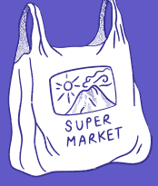
bolsas de supermercado

Pajitas de metal, bambú o vidrio que puedas lavar y usar varias veces