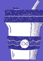
tosas plásticas para el café y sus tapas

contenedores reutilizables para almacenar alimentos en lugar de envases desechables.