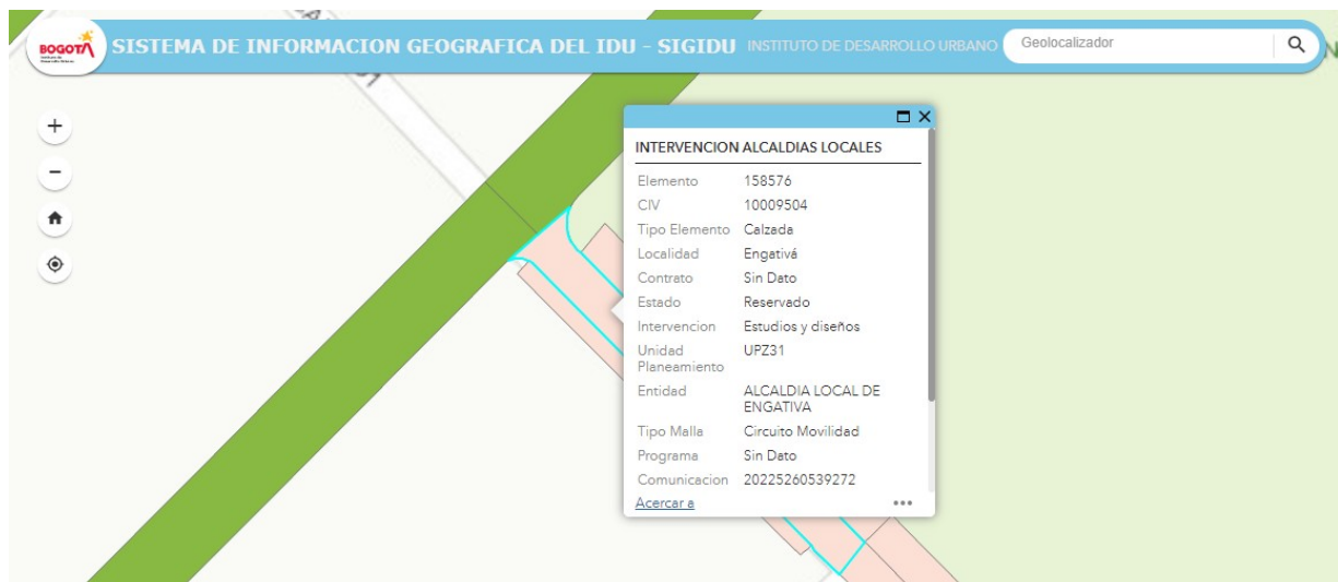
FIGURA 1. Fuente: SIGIDU (30-Marzo-2023)

CIV: Código de Identificación Vial / LO: Malla vial local / IN: Malla vial Intermedia / AR: Malla vial Arterial / SE Sin Especificar