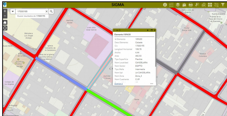
Imagen No. 2 Fuente: SIGMA (20 enero-2023) CIV – 17000195 PK 189630 Se adjunta registro fotográfico de la intervención.