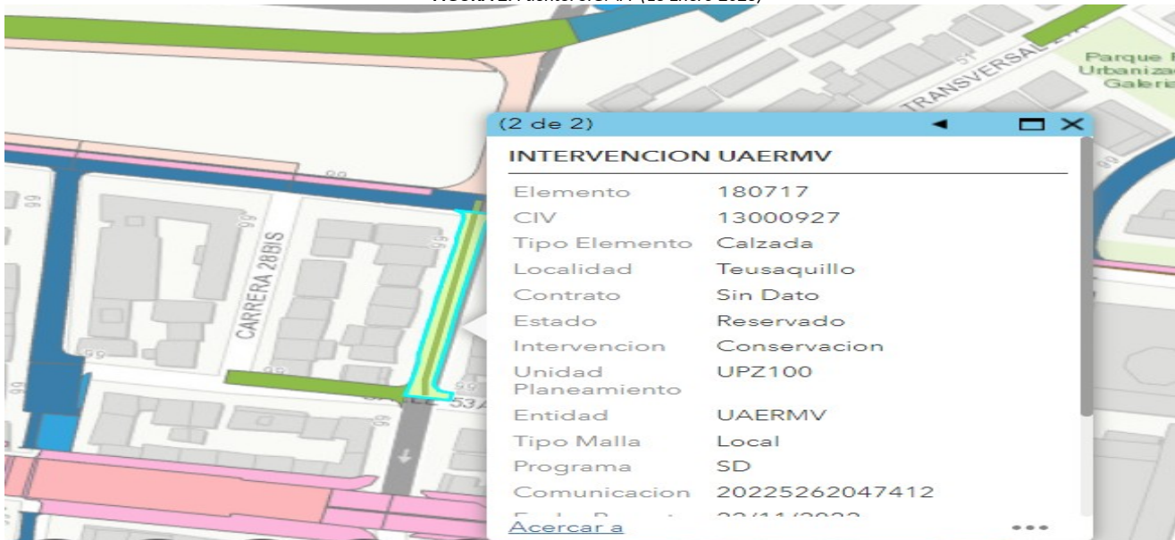
FIGURA 3. Fuente: SIGIDU (18-enero-2023)

Es importante mencionar que, de conformidad con el numeral 3º del artículo 5º del Acuerdo 740 de 2019, son deberes de las alcaldías locales: “los Alcaldes Locales tienen las siguientes competencias que se desarrollarán en el ámbito local: (...) 3) Adelantar el diseño, construcción y conservación de la malla vial local e intermedia, del espacio público y peatonal local e intermedio; así como de los puentes peatonales y/o vehiculares que pertenezcan a la malla vial local e intermedia, incluyendo los ubicados sobre cuerpos de agua. Así mismo, podrán coordinar con las entidades del sector movilidad