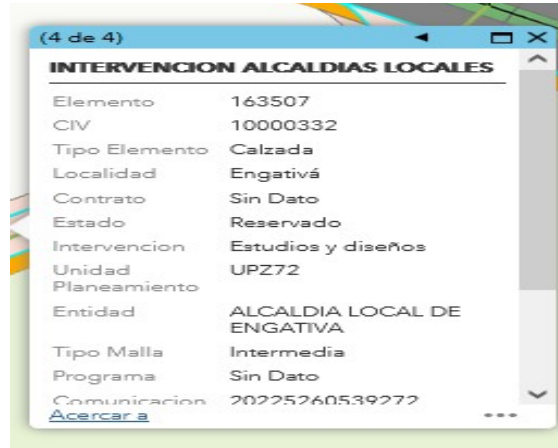
FIGURA 1 - SIGIDU (13-enero 2023)

Esta Subdirección informa que de acuerdo con la verificación efectuada y con base en los datos registrados en el SIGIDU y el SIGMA, el tramo correspondiente a la dirección de su solicitud se encuentra reservado por parte del Fondo de Desarrollo Local de Engativá. (Figura 1).