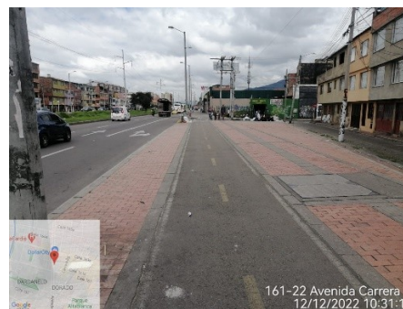
Cicloruta Anden oriental