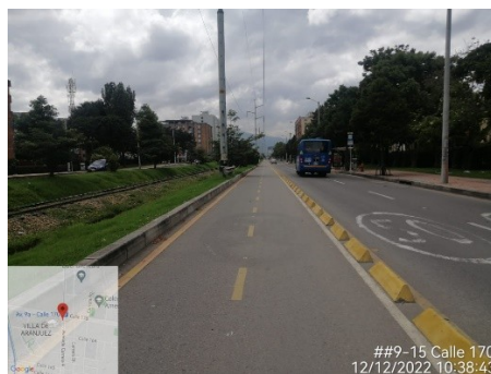
Cicloruta calzada occidental

Por medio de la presente se da respuesta a su petición con radicado UMV No 20221120141822, en cual informa que "...Carrera 9 con calle 170 hasta la carrera 9 con calle 127 hay ciclorruta sobre la carrera 9 y ciclorruta sobre el andén, quien planea eso si le quitan un carril a los vehículos y pintan huecos en vez de tapparlos...", al respecto la Unidad Administrativa Especial de Rehabilitación y Mantenimiento Vial -UAERMV informa que: se realizó la vista técnica al segmento encontrando lo siguiente: