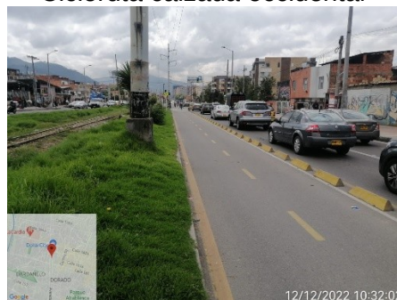
Cicloruta calzada occidental