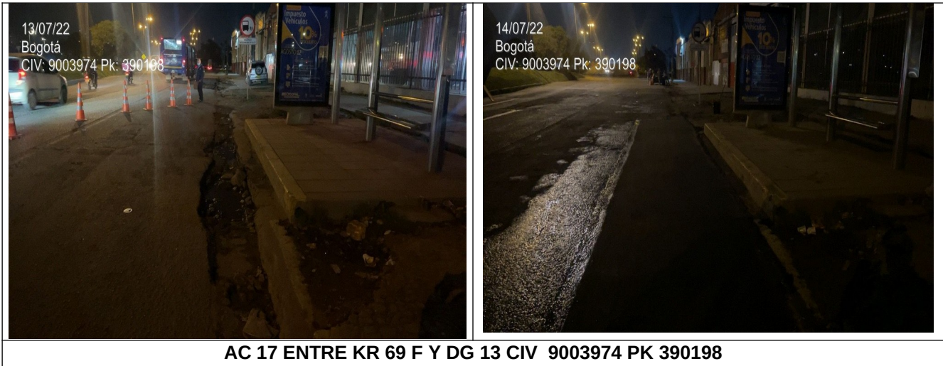
AC 17 ENTRE KR 69 F Y DG 13 CIV 9003974 PK 390198

La Gerencia de intervención continuará adelantando los recorridos de verificación para establecer los sitios más afectados (con huecos) con el fin de programar la intervención en los sitios críticos que dificultan la movilidad de la Avenida centenario en las dos calzadas, se continuará con las intervenciones de acuerdo con la capacidad operativa con que cuente la unidad.